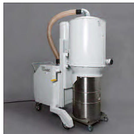
200 Liter-Fass mit Fahrwagen