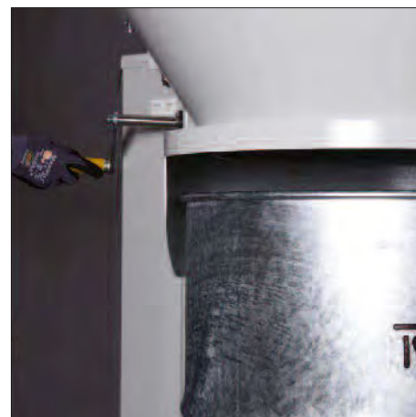
Exakte Anpassung an die jeweilige Abscheide-Einheit