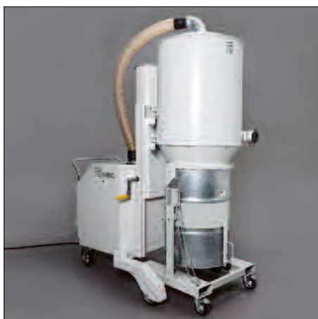
200 Liter-Fass mit Kippvorrichtung und Stapeltaschen