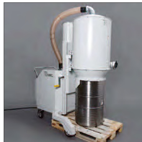
200 Liter-Fass auf Europalette