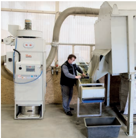
DS 64400 in der Tiernahrungs- verarbeitung