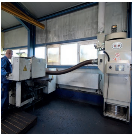
DS 63000 in der Metallverarbeitung