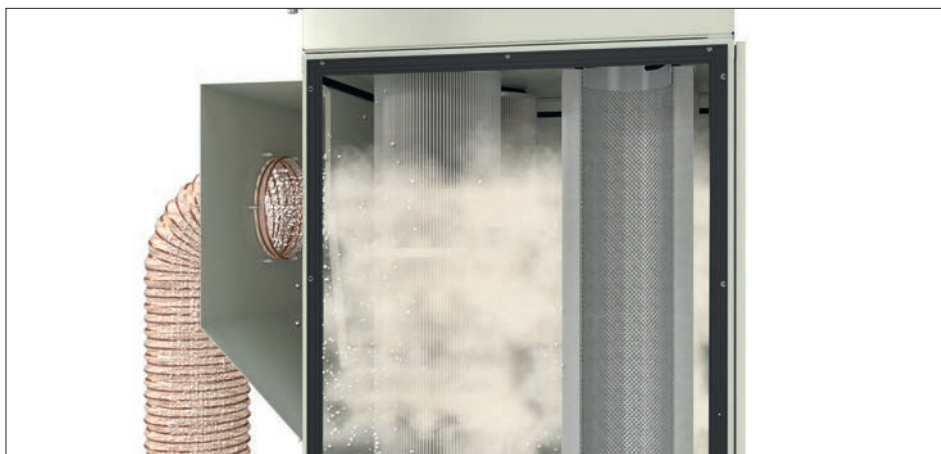
DS 6 mit differenzdruckgesteuerte Druckluft-Abreinigung