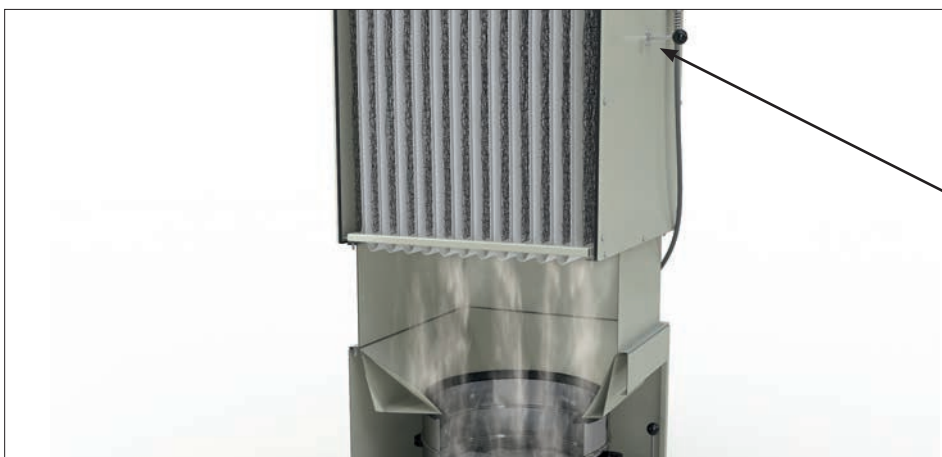
DS 6 effektive Handabreinigung