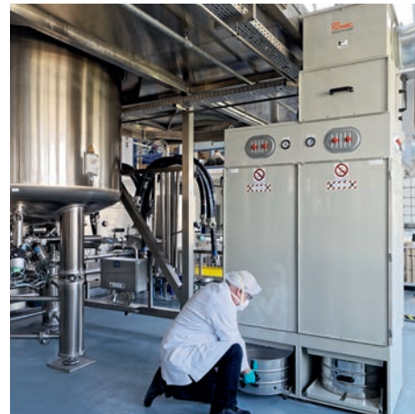
DS 65600 in der kosmetischen Industrie