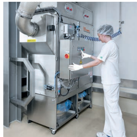
DS 64000 in der Lebensmittel- verarbeitung